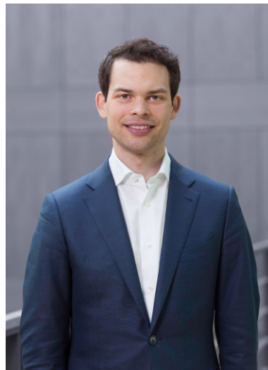
Dr. Christoph Ploß, MdB