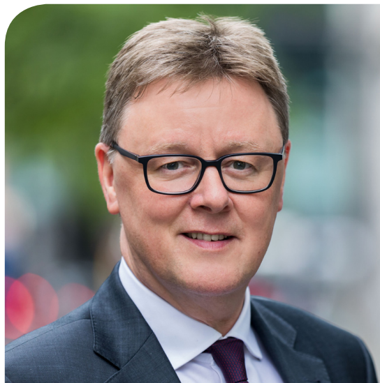
Michael Grosse-Brömer MdB